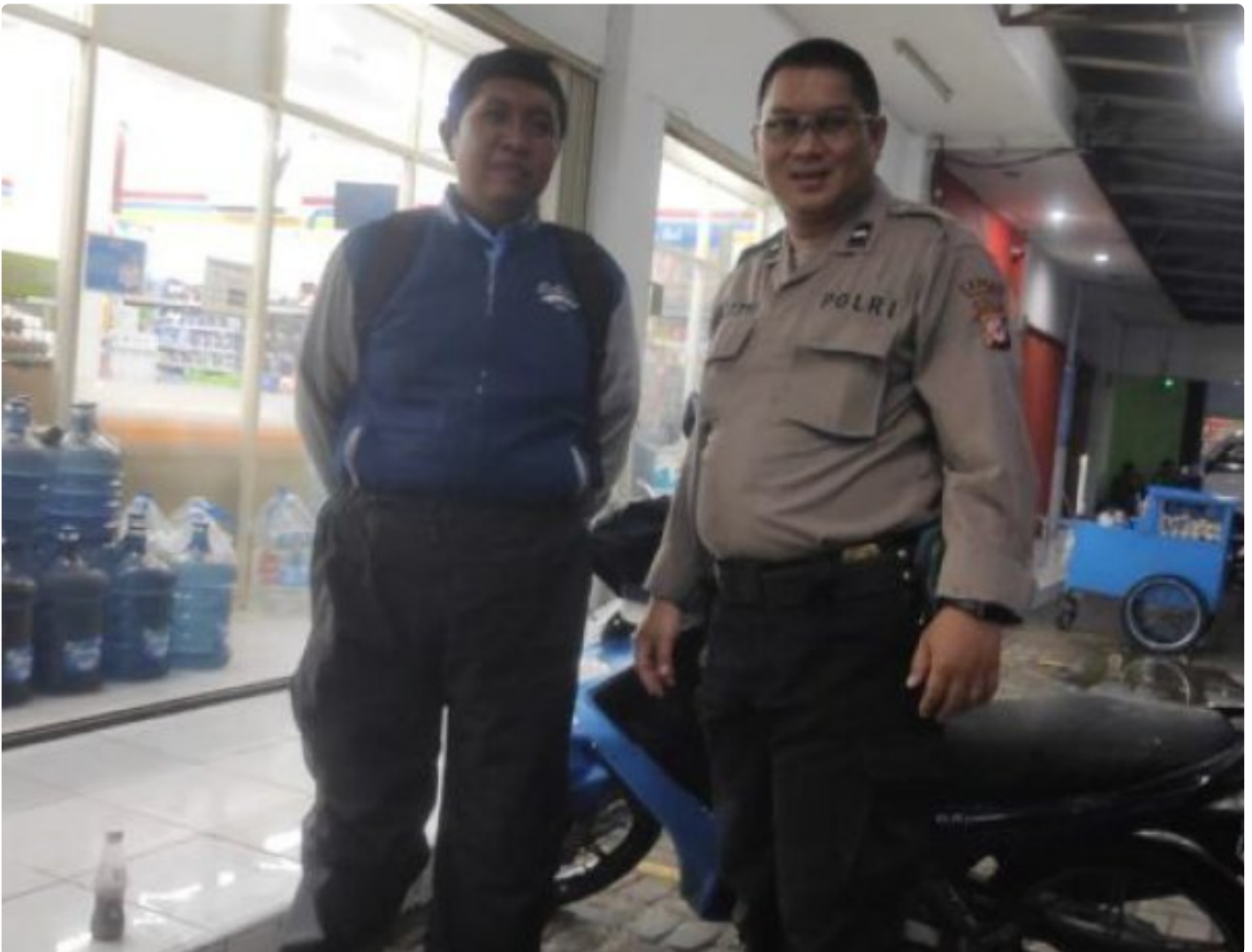
Polsek Kebon Pedes Polres Sukabumi Kota

Kota Sukabumi – Polres Sukabumi Kota Polda Jawa Barat, Polsek Kebon Pedes kembali melaksanakan patroli malam hari guna mencegah tindak kejahatan pencurian kendaraan bermotor (curanmor) di wilayah kecamatan Kebon Pedes.