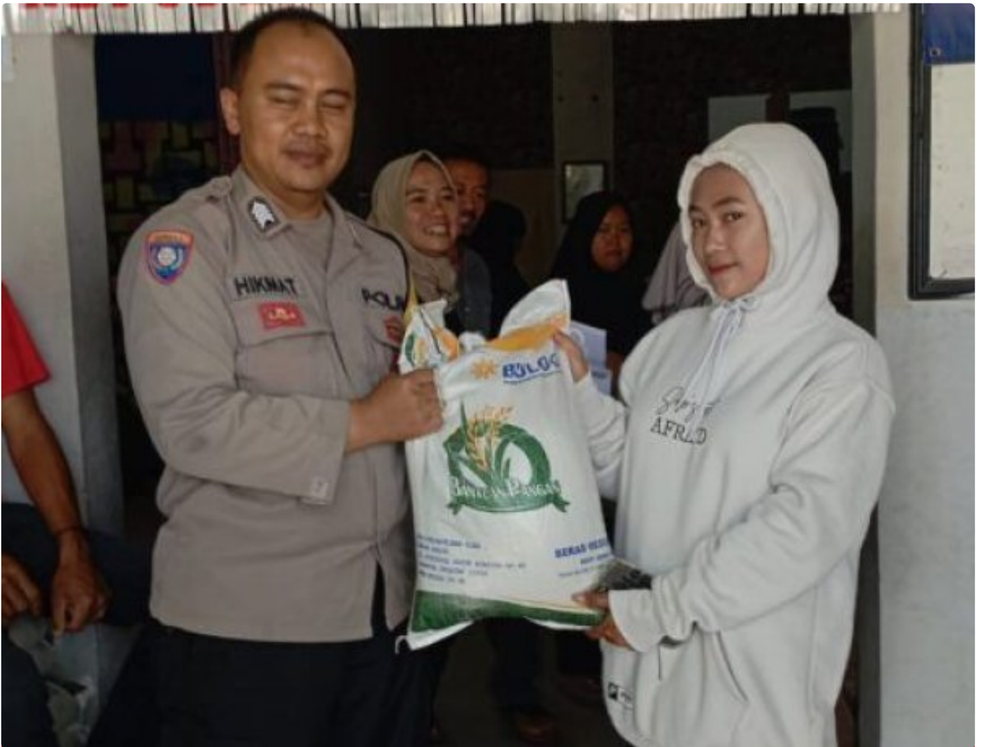
Polsek Cisaat Polres Sukabumi Kota